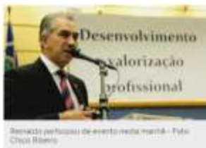
Reinaldo participou de evento nesta manhã

O governador Reinaldo Azambuja (PSDB) participou nesta segunda-feira (5) da abertura do IX Consee (Congresso Nacional dos Engenheiros), que acontece de hoje até quarta-feira (7) em Campo Grande, com o objetivo de discutir o desenvolvimento e a valorização profissional da categoria.